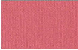
Coral – 233VI