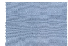
Støv blå 18IT

Denne vil føles lidt kølig i overfladen, men det helt lette og tynde materiale, gør det lettere for dunene at være tæt på din hud og give den optimale isolation (varme påvirkning)